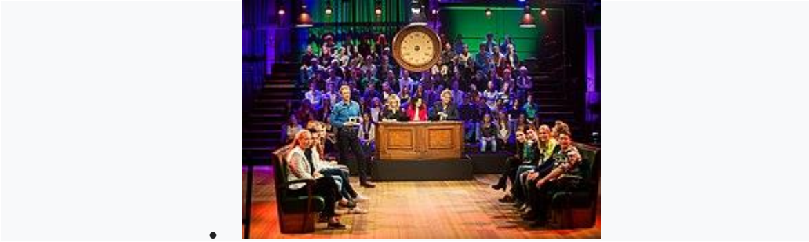
Finale Op Weg naar het Lagerhuis met de Vara 2015

HOPE XXL organiseerde vanaf 2013 tot en met 2019 in samenwerking met de VARA en 250 middelbare scholen en 2500 leerlingen uit alle provincies het programma "Op weg naar het Lagerhuis".