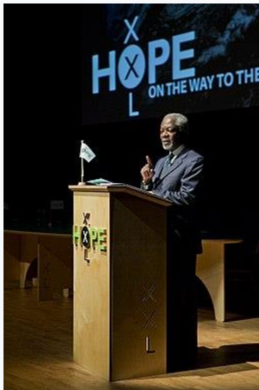
Kofi Annan spreekt op HOPE XXL conferentie in de Stadsgehoorzaal