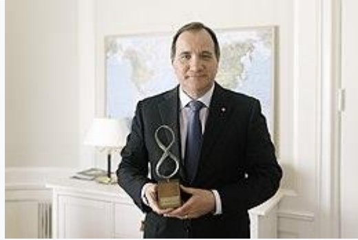
Stefan Löfven, premier Zweden met de HOPE XXL CUMULA

HOPE XXL staat voor Human Odyssey of People's Elevation . In 2009 kwam een groep bestaande uit tien jongeren (X) tien keer (X) bij elkaar in de regio de Liemers (XXL) om te filosoferen over een betere wereld, een oktopische samenleving waarin iedereen zijn of haar leven als goed (cum laude, met een 8) kan waarderen. De groep en het aantal bijeenkomsten zijn door blijven groeien. Wereldwijd hebben, gedurende een periode van vijf jaar, duizenden jongeren en honderden nationale en internationale prominenten en professoren meegedacht en meegepraat over de doelstellingen van HOPE XXL. De thema's waren sociale, economische en ecologische duurzaamheid, duurzame vrede en veiligheid en internationale samenwerking.